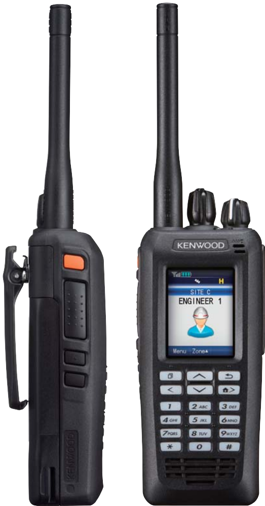
TK-D200(G)/D300(G) modelo con LCD