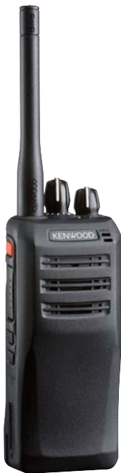
TK-D200(G)/D300(G) modelo sin-teclado, sin-LCD